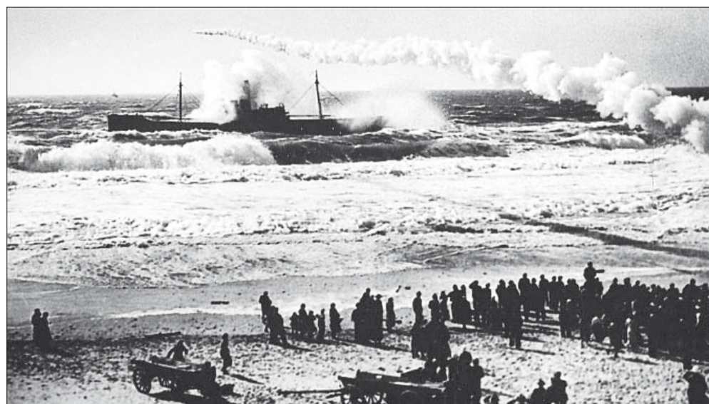
Thistedfotografen Aage Petersen var på pletten, da den damperen "Sprightly" af Newcastle på 1899 bruttoregister-ton strandede nord for Lyngby Landingsplads på en rejse fra England til Aalborg med kul. Hele besætningen endte med at blive reddet, men redningsfolkene havde slidt og slidt, også med en kaptajn, der ikke ville give op. Hele historien er med i Sydthy Årbog 2011.

Hans dagsbogsnotater fra krigens tid er på én gang så lokale, personlige og tillige sat ind i den helt store globale sammenhæng, at de - i denne årbog dækkende året 1945 - kunne danne udgangspunkt for en dokudramatisk film eller måske et skuespil om, hvad unge mennesker i et lille fiskerleje på Thykysten talte om og tænkte på dette afgørende år i verdenshistorien.