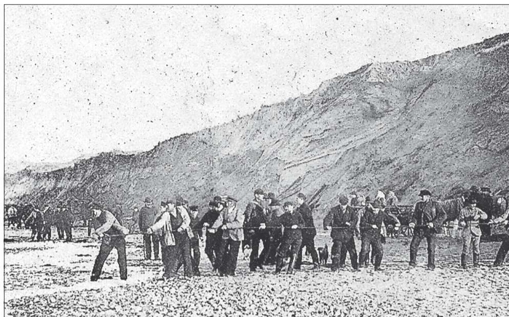
11. januar 1907 strandede damperen "Cabral" på kysten nord for Lodbjerg Fyr. Mange lokale hjalp til med at redde skibets besætning og last.

THY-HANNÆS: Når en bus med omkring 55 ledige akademikere i dag, onsdag, besøger virksomheder i Thy, sker det ikke alene i et samarbejde mellem kommune, universitet, a-kasser og organisationer, som Thisted Dagblad skrev i går. Initiativet til busturen til Thy er taget af Thy Erhvervsråd.